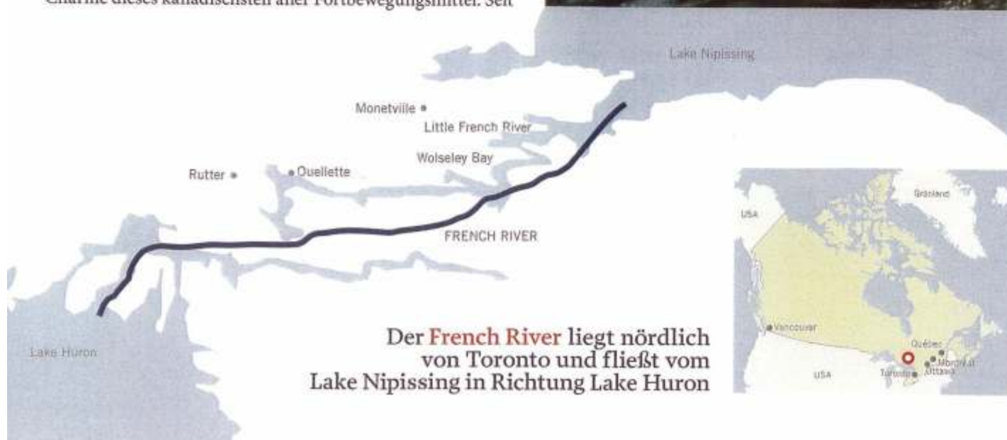
Der French River liegt nördlich von Toronto und fließt vom Lake Nipissing in Richtung Lake Huron