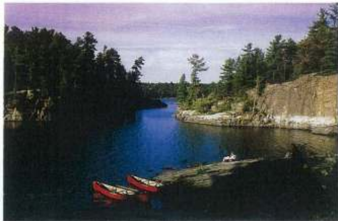
Fluss-Labyrinth: Buchten, Haupt- und Seitenarme des Gewässers lassen sich am besten per Kanu erforschen

Am frühen Abend kündigen Wochenendhäuser die Zivilisation an. Kurz vor den Recollet Falls laufen wir in eine sichere, kleine Bucht ein. Auch hier haben Mokassins in vielen hundert Jahren einen Pfad in den Fels gerieben. Wir würden am liebsten der Pelzhändler-Route folgen, durch den North Channel in den Lake Huron, durch den St. Mary's River in den Lake Superior und bis nach Thunder Bay. Doch unsere Reise ist hier zu Ende. Der French River dagegen strömt tiefblau und ewig weiter, dem Sonnenuntergang entgegen. ■