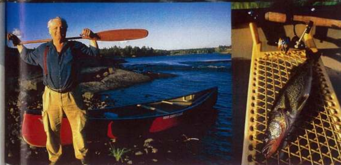
Weiß alles über den Fluss: Toni Harting. Abends im Camp wird der frisch gefangene Fisch gegrillt