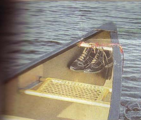
Was an seinem Platz: Die Schuhe werden aufgehängt, denn Kanuten brauchen Beinfreiheit

Die Provinz Ontario liegt im Norden an der Hudson Bay und der James Bay, im Osten an die Provinz Québec, im Süden an dem St. Lawrence-Strom und die Großen Seen und im Westen an die Provinz Manitoba. Ontario ist mit etwas mehr als einer Million Quadratkilometern Kanadas zweitgrößte Provinz.