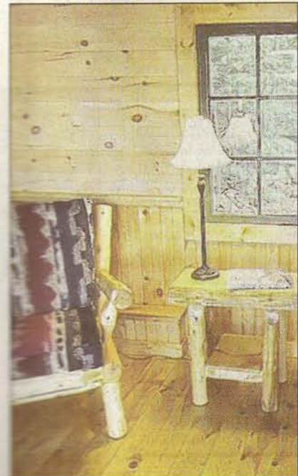
Echt Holz: Die Inneneinrichtung der Lodge at Pine Cove ist rustikal