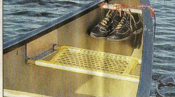
Alles an seinem Platz: Die Schuhe werden aufgehängt, denn Kanuten brauchen Beinfreiheit