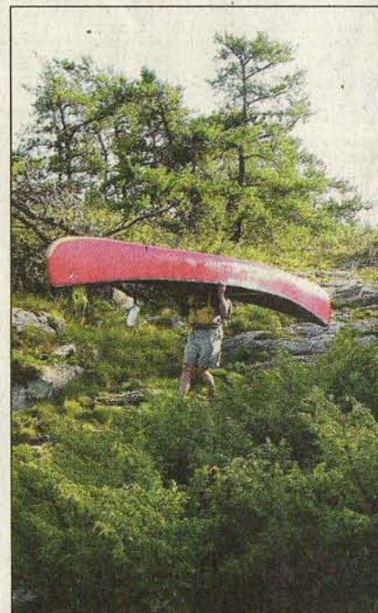
Echte Knochenarbeit: Wer sein Kanu liebt, der trägt

war für die Einwohner der großen Städte von Kanadas Ostens wie Toronto, Montreal oder Ottawa das Cottage in der mit Seen und Flüssen durchzogenen Wildnis Ontarios. Mit dem Unterschied, dass die Provinz Ontario mit einer Million Quadratkilometer etwa dreimal so groß ist wie Deutschland.