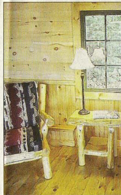
Echt Holz: Die Inneneinrichtung der Lodge at Pine Cove ist rustikal