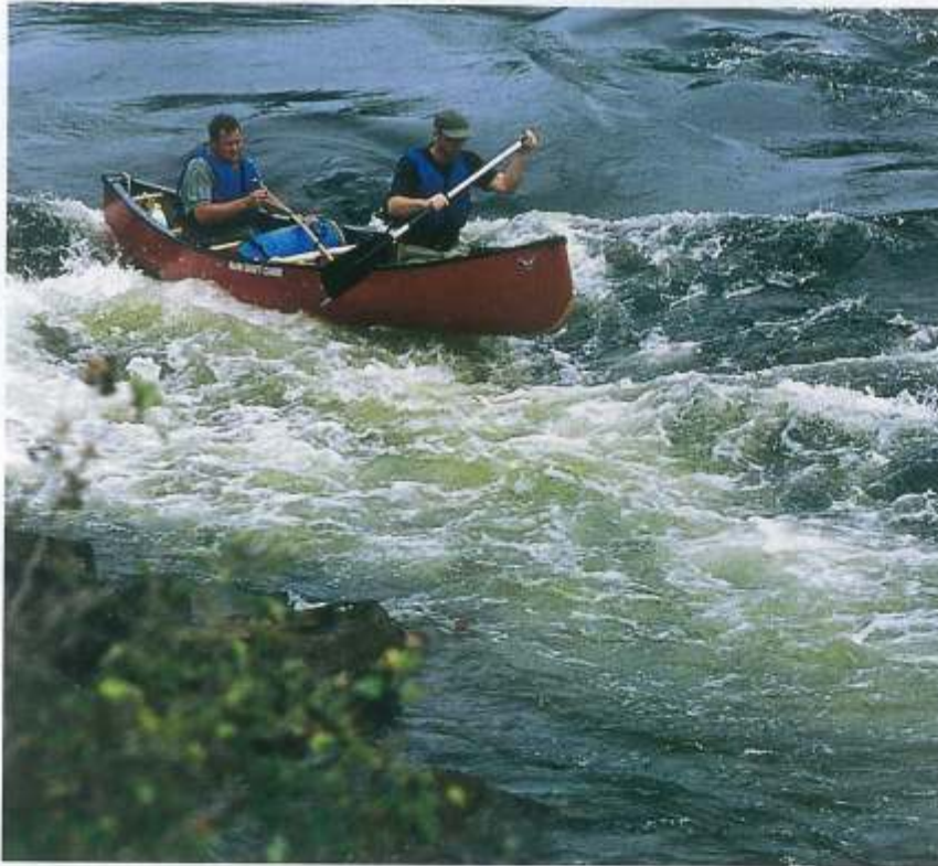
Geschafft: Die schäumende Devil's Chute ist gemeistert.

ter breites Waschbrett mit anderthalb Meter hohen Rillen aus schäumendem H 2 O erzeugt. Die Kanus über Land schleppen müssen wir trotzdem nicht. Wir gleiten auf einer tiefblauen, weit über das Waschbrett leckenden Zunge mitten durch das tosende Spektakel, ohne das auch nur ein Spritzer über die Bordwände schlägt. Ein absolut geiles Feeling, von dem wir noch mehr wollen. Unterhalb von Blue Chute laden wir aus und gehen mit unseren Kanus spielen. Resultate siehe oben. Die Big Parisian Rapids und Devil's Chute etwas später sind komplizierter. Wir schleppen alles über Land, was nicht nass werden darf, und machen die Schnellen leer. Devil's Chute ist tückisch, die s-förmige Schnelle zwingt zu Trickserien im Wildwasser.