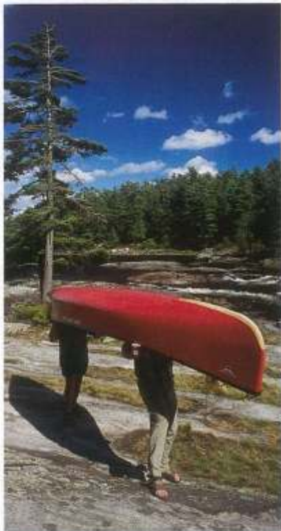
Wer den ganzen Tag schuftet, hat sich ein kräftiges Abendessen redlich verdient.