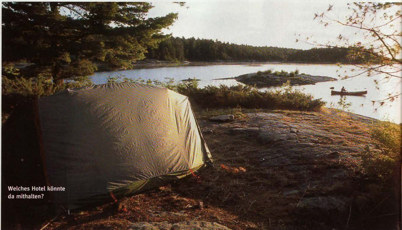
Welches Hotel könnte da mithalten?

mitteln geschultert und an dem tosenden Inferno vorbei gekraxelt. „Ihr seid nicht die ersten“, sagt Toni und zeigt auf den glatten, merkwürdig blanken Granit. Indianer, Waldläufer, Missionare, Voyageurs, Entdecker, sie alle schleppten hier ihre Kanus vorbei. Schwitzten und fluchten genauso wie wir jetzt. An diesem Tag campieren wir bei den Double Rapids.