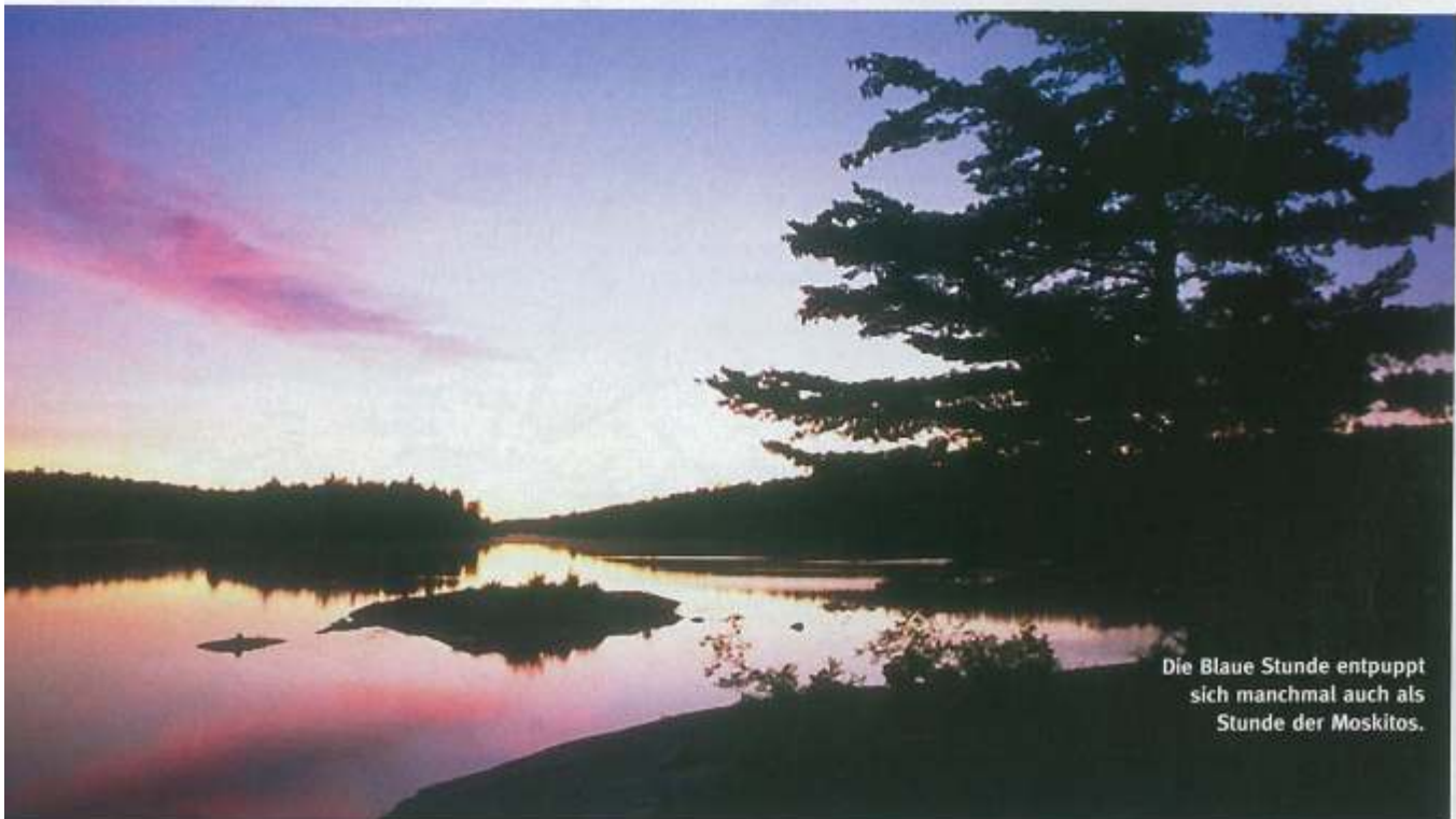
Die Blaue Stunde entpuppt sich manchmal auch als Stunde der Moskitos.

nun vom Ufer aus. Keine Felsbrocken dicht unter der Oberfläche, keine böse Überraschungen in unübersichtlichen Kurven. Eine gerade, zehn Meter breite Passage mit hohen Granitwänden erwartet uns. Anderthalb Meter Gefälle. Die dadurch vervielfachte Fließgeschwindigkeit und die stehenden Wellen haben ein etwa fünfzig Meter langes und sechs Me-