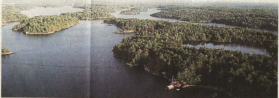
Tentakeln gleich furchen sich die unzähligen Wasserarme des French River ins Land

Blockhütten, die über das weitläufige, bewaldete Gelände verteilt sind. In Prunk und Luxus kann der Reisende nicht schwelgen, doch es fehlt an nichts – abgesehen von TV-Geräten, Radios, einem Mobilfunk-Netz und ähnlichen Segnungen der Moderne. Dafür lassen sich von der Veranda aus Waldhörchen, Kraniche, Gänse und Biber beobachten.